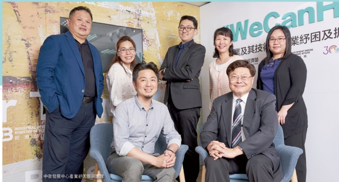
中衛發展中心產業紓困振興團隊

生化工次之，佔比為二七·七%，技術服務業及電子資訊業佔比分別為一八·四%及一三%，另觀光工廠、創意生活、永續發展業者也有提出申請，但核准件數不多，均未超出百件。 總體來說，這次的疫情不論是製造業、商團、農業無一倖免，特別是台灣引以為傲的台灣蘭花、鳳梨釋迦、鳳梨、石斑魚、午仔魚的出口更是受到嚴重。於此同時，中衛發展中心也協助業者換位思考，細思在外銷市場仍受疫情影響的狀況下，如何將外銷轉成內銷，幫忙去化產品。 甚或協助農漁民將有生命週期限制的農產品經由二次加工做成禮盒或是開發成料理包，甚至中衛也透過執行政府相關計畫開辦通路聯合會，將農企業和量販店、連鎖超市、網路電商、餐飲集團拉在一起，從而幫家樂福、棉花田、王品集團找到了合格的供應商。 此外，透過輔導資源協助業者網站行銷，也是因應業者發展的零接觸經濟，好比協助雲林地區以CAS（企業對企業）為主的蔬果批發農企業及相關產銷履歷業者增開新戰場，以B2C（企業對消費者）的型式，在